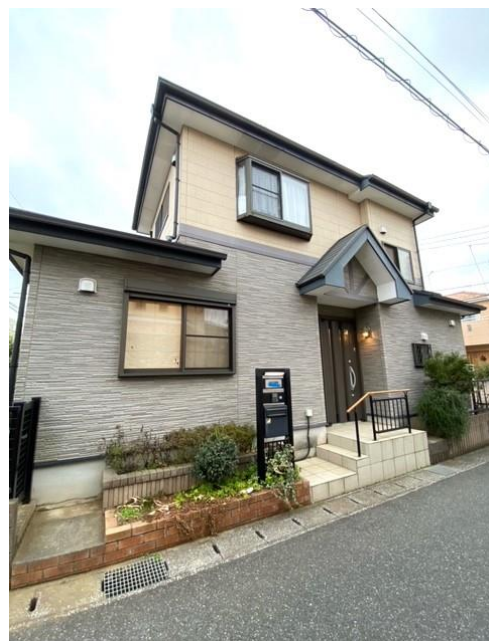
現地外観写真（撮影2023年1月）