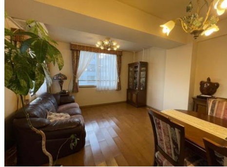
リビング (南西×南東の角部屋 陽当たり良好)