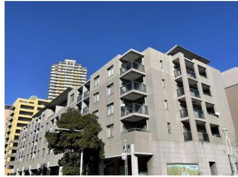
現地外観写真 南西×南東の角部屋