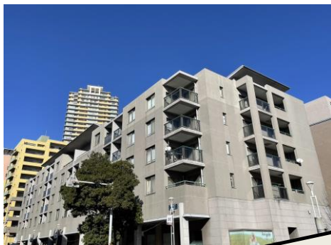
現地外観写真 南西